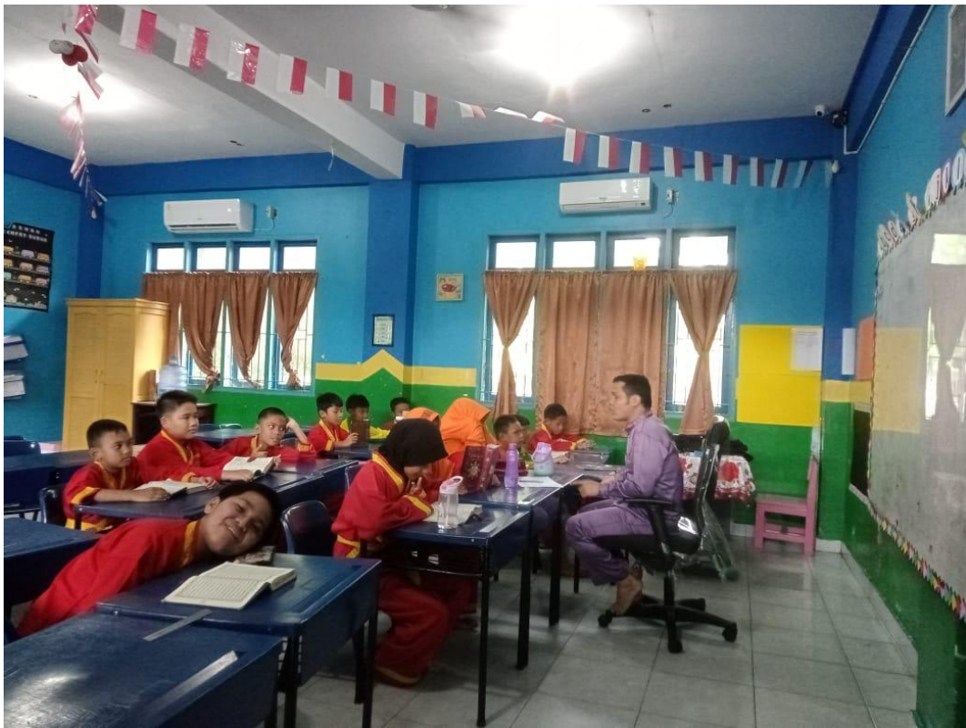
Kegiatan Belajar Mengajar Ekstrakurikuler Keagamaan