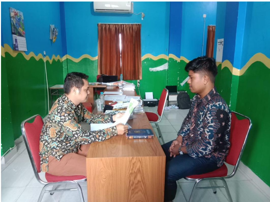
Wawancara Dengan Guru Ekstrakurikuler Keagamaan