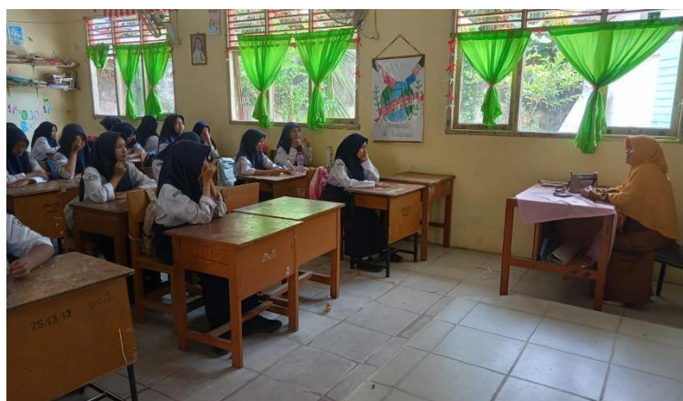
Gambar 2 Guru Menjelaskan Materi Pembelajaran