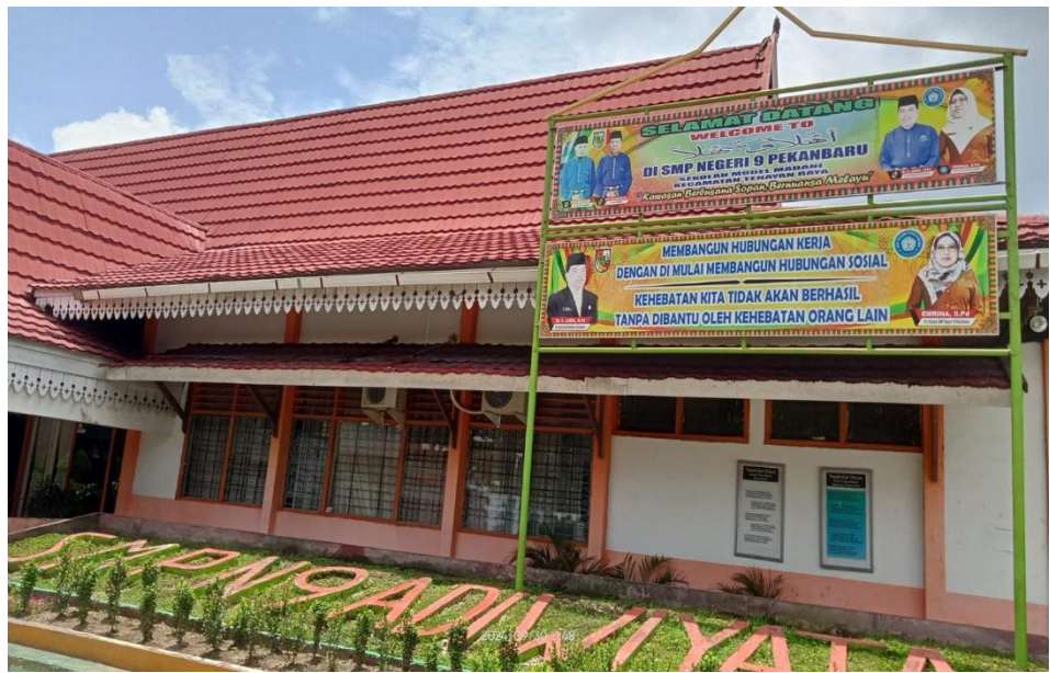
Gambar 5 Lokasi SMP N 09 Pekanbaru