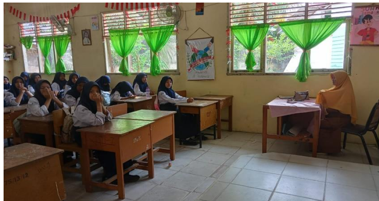
Gambar 1 Kegiatan Pelaksanaan Pembelajaran PAI di SMP N 09 Pekanbaru