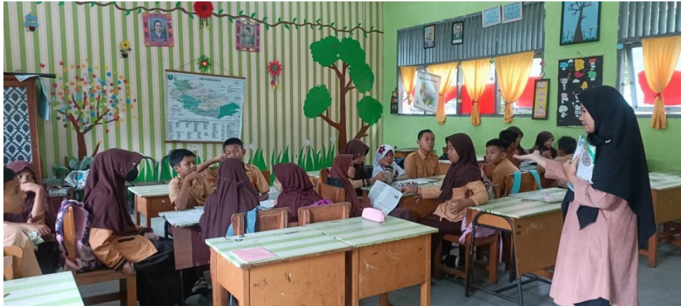
Peserta didik mengerjakan soal