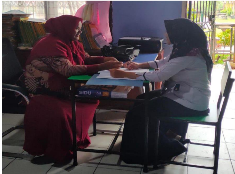
Peneliti sedang mewawancarai informan penelitian (Guru Pendidikan Agama Islam)