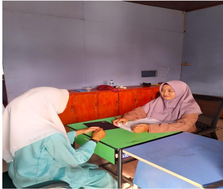
Peneliti sedang mewawancarai informan penelitian (Siswa SMA Negeri 1 Tapung Hulu)