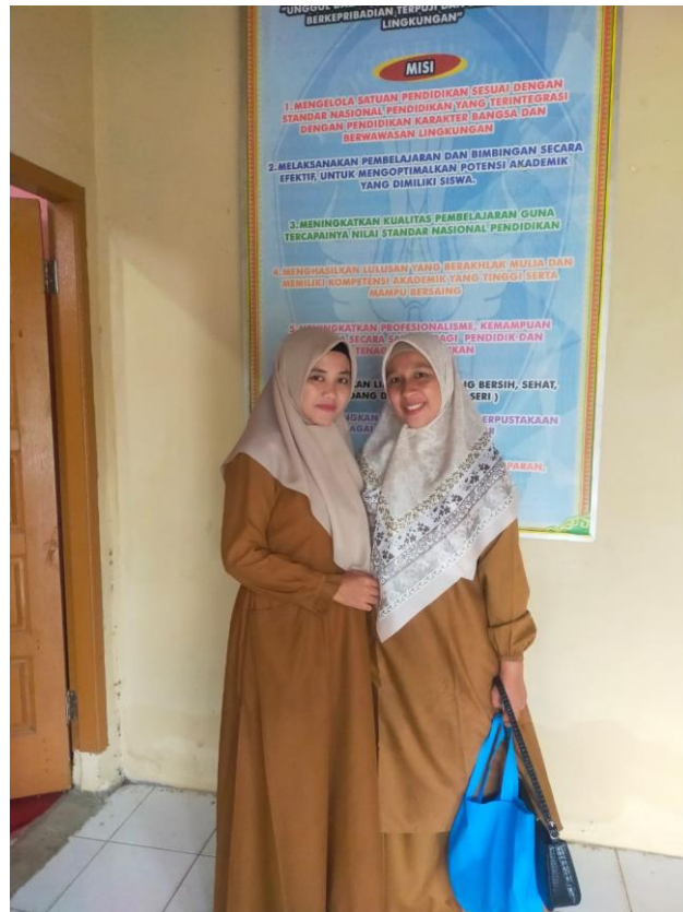
Peneliti salah satu guru pendidikan agama islam