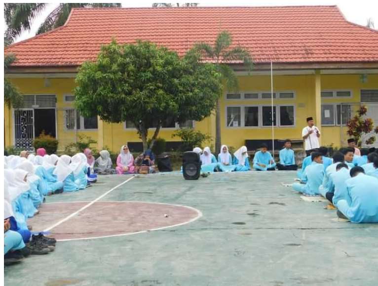
Kegiatan kerohanian (KULTUM Jumat)