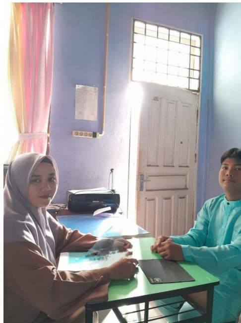
Peneliti sedang mewawancarai informan penelitian (Siswa SMA Negeri 1 Tapung Hulu)