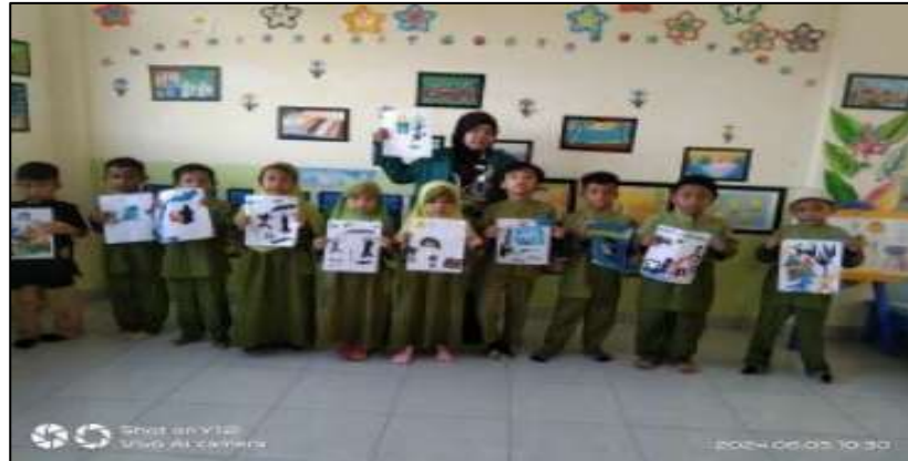
Gambar 6. Guru dan Anak