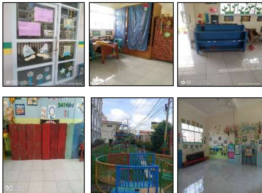
Gambar 4. Ruang Kelas, Ruang Bermain

Alat permainan yang ada di sekolah seperti ayunan, seluncuran, dan putaran dll.