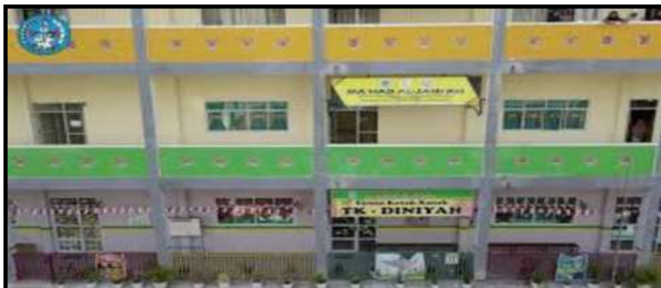
Gambar 3. Profil TK Diniyyah