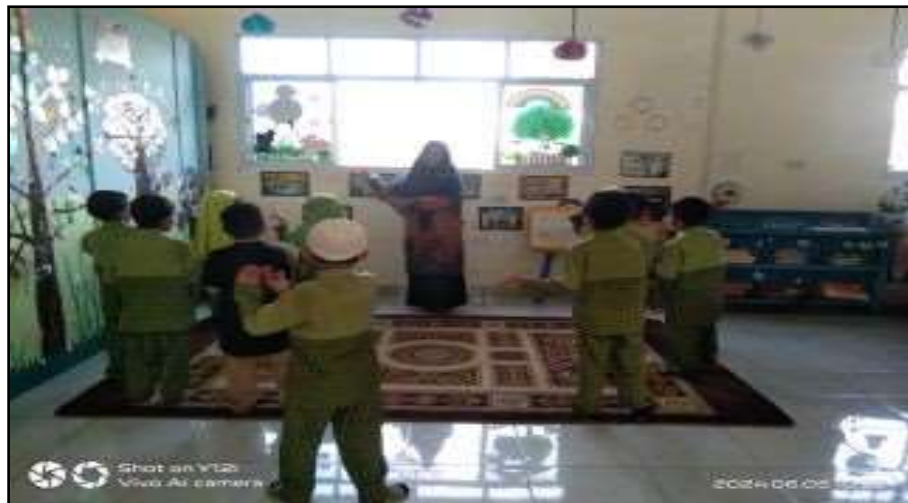
Gambar 5. Guru dan Anak