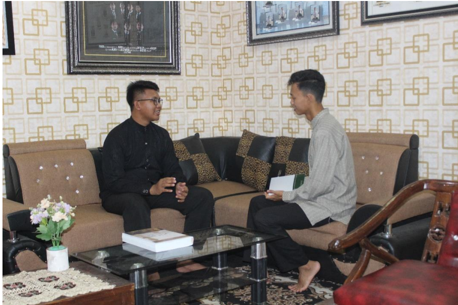
Wawancara dengan wali kelas 2