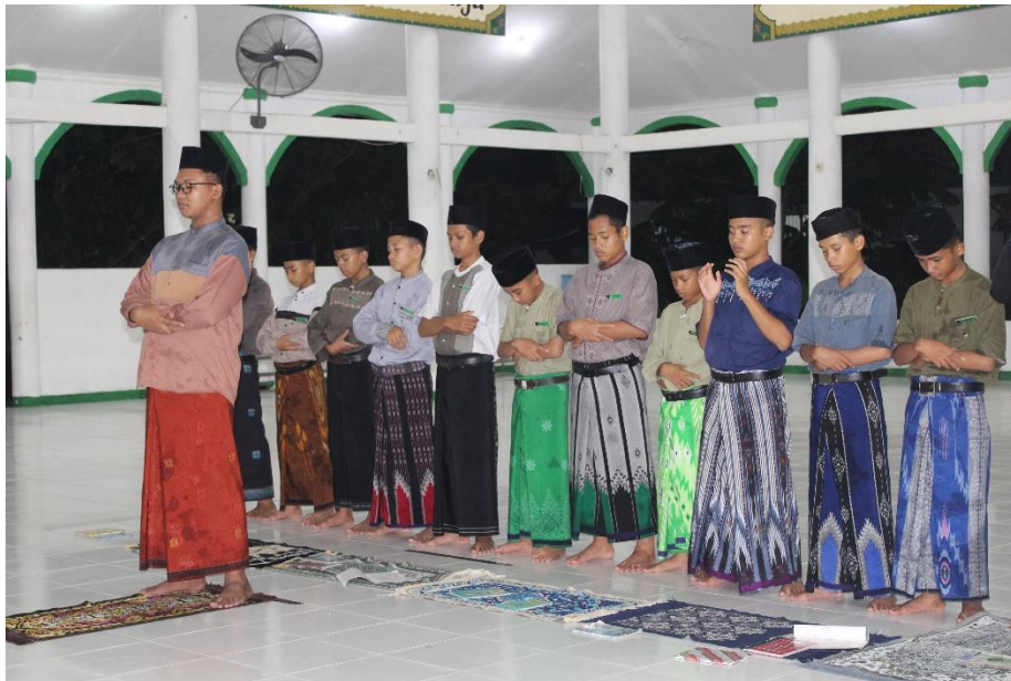
Pembinaan akhlak dengan sholat berjamaah dimasjid