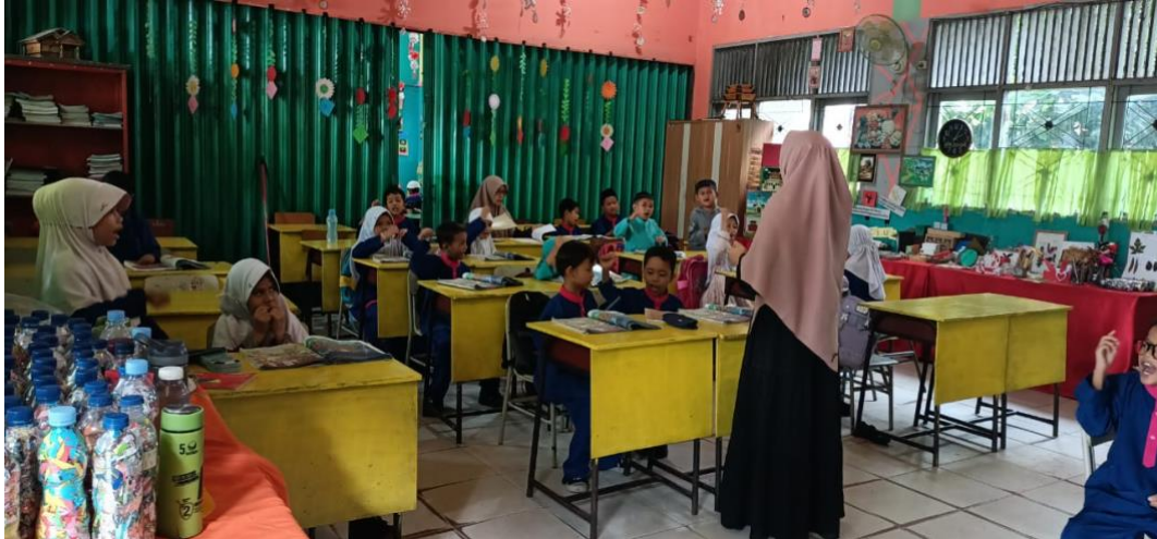
KEGIATAN PROSES BELAJAR MENGAJAR DI SDN 153 PEKANBARU 2024