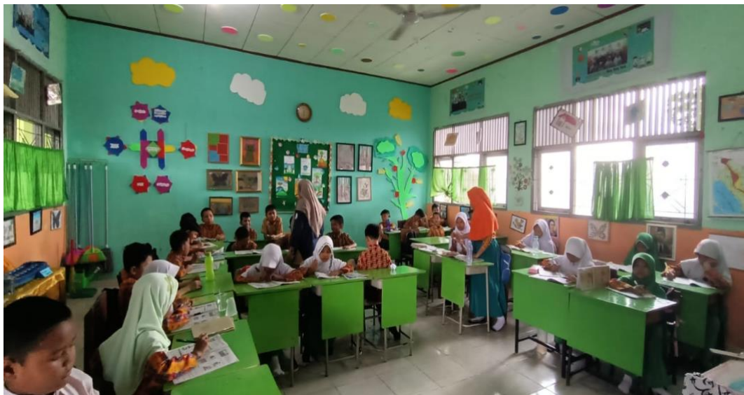
KEGIATAN PROSES BELAJAR MENGAJAR DI SDN 153 PEKANBARU 2024