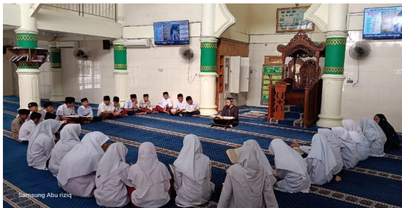
Gambar 3 Guru Menjelaskan Materi