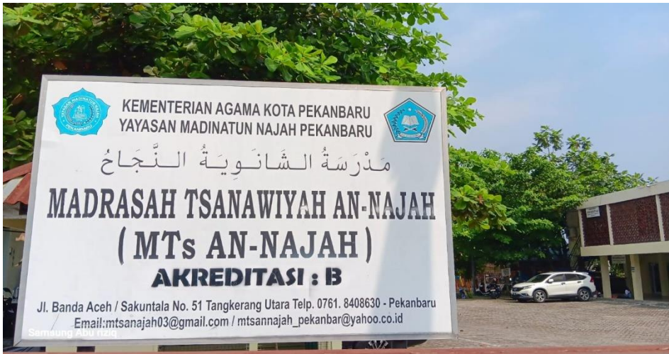
Gambar 7 Lokasi MTS An-Najah Pekanbaru