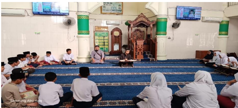
Gambar 2 Kegiatan Pembelajaran Seni Baca Al Quran