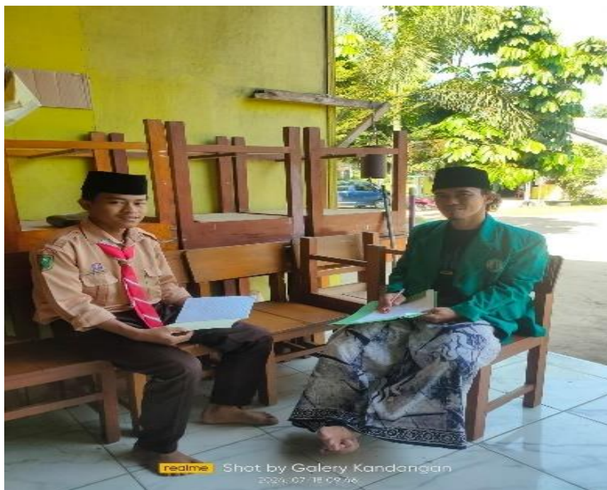
Foto kegiatan wawancara dengan santri