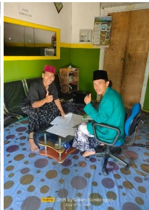
Foto kegiatan wawancara pengasuh dan pengurus