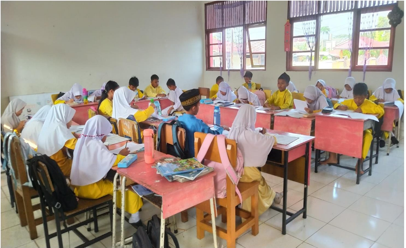
Keterangan : Para siswa kelas 4 SD Negeri 108 Pekanbaru sedang mengisi kuesioner/angket.