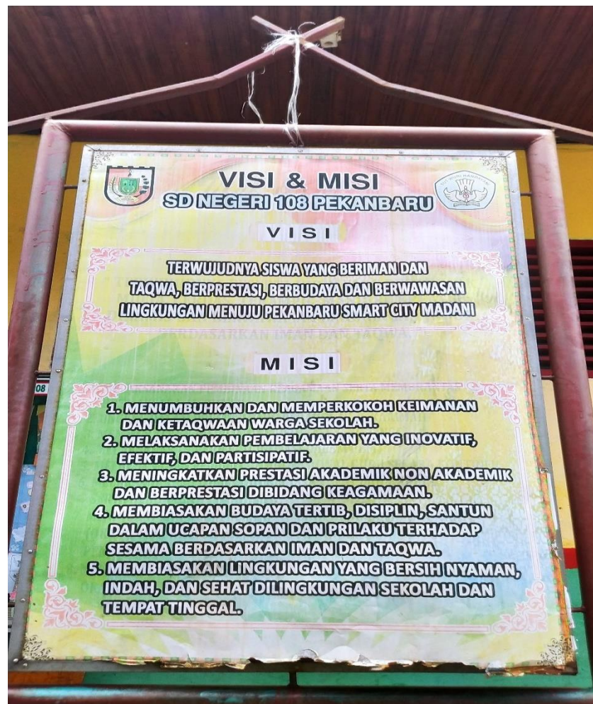
Keterangan Gambar : Visi & Misi SD NEGERI 108 PEKANBARU