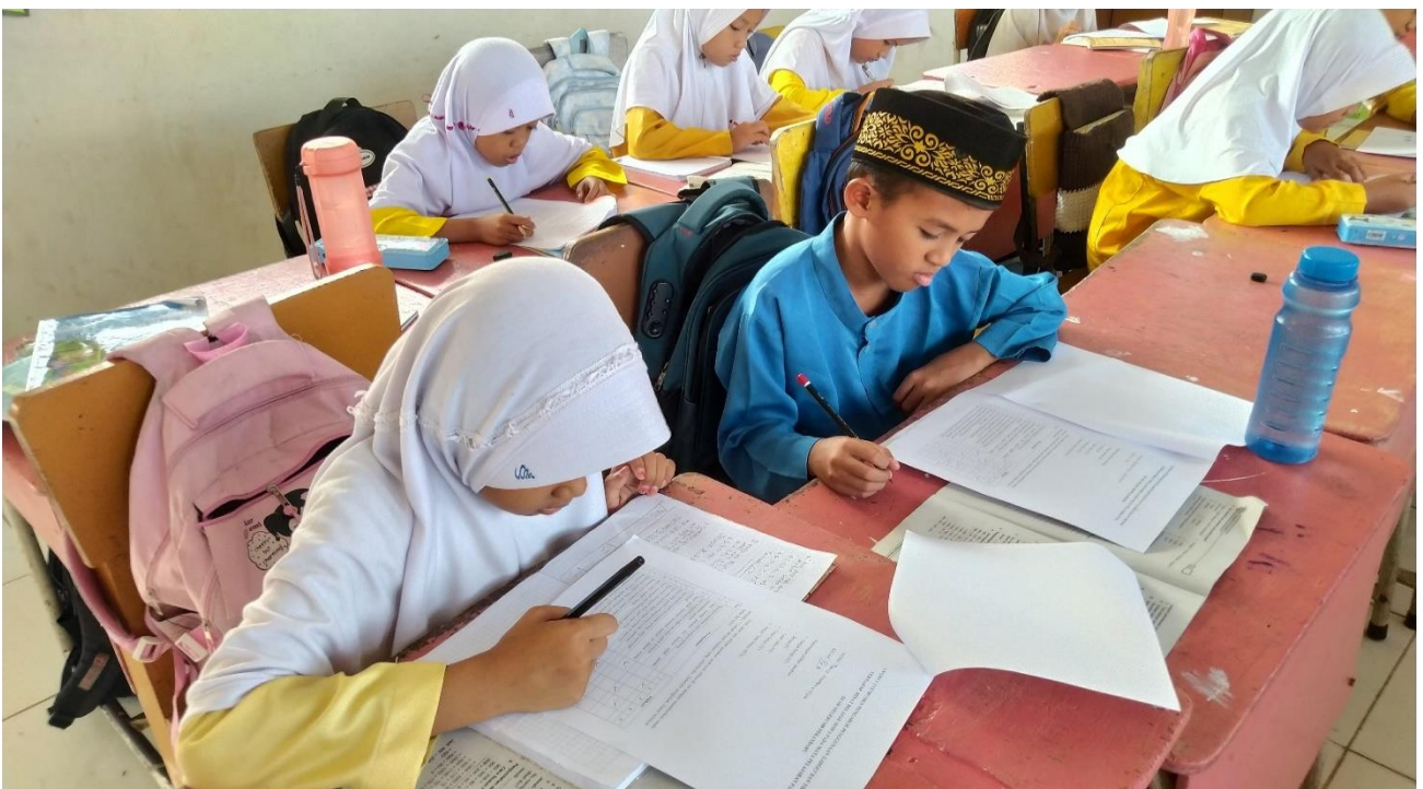
Keterangan : Beberapa siswa kelas 4 SD Negeri 108 Pekanbaru yang tengah fokus mengisi kuesioner/angket.