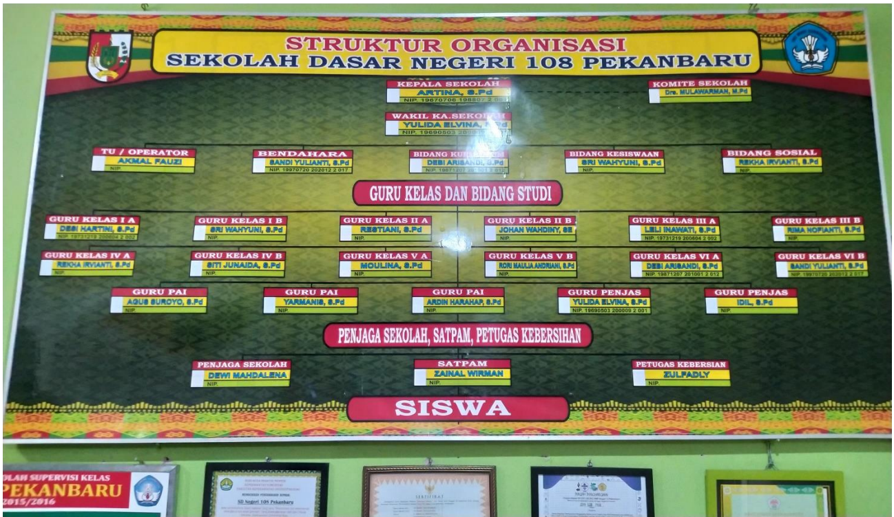
Keterangan : Struktur Organisasi SD NEGERI 108 PEKANBARU