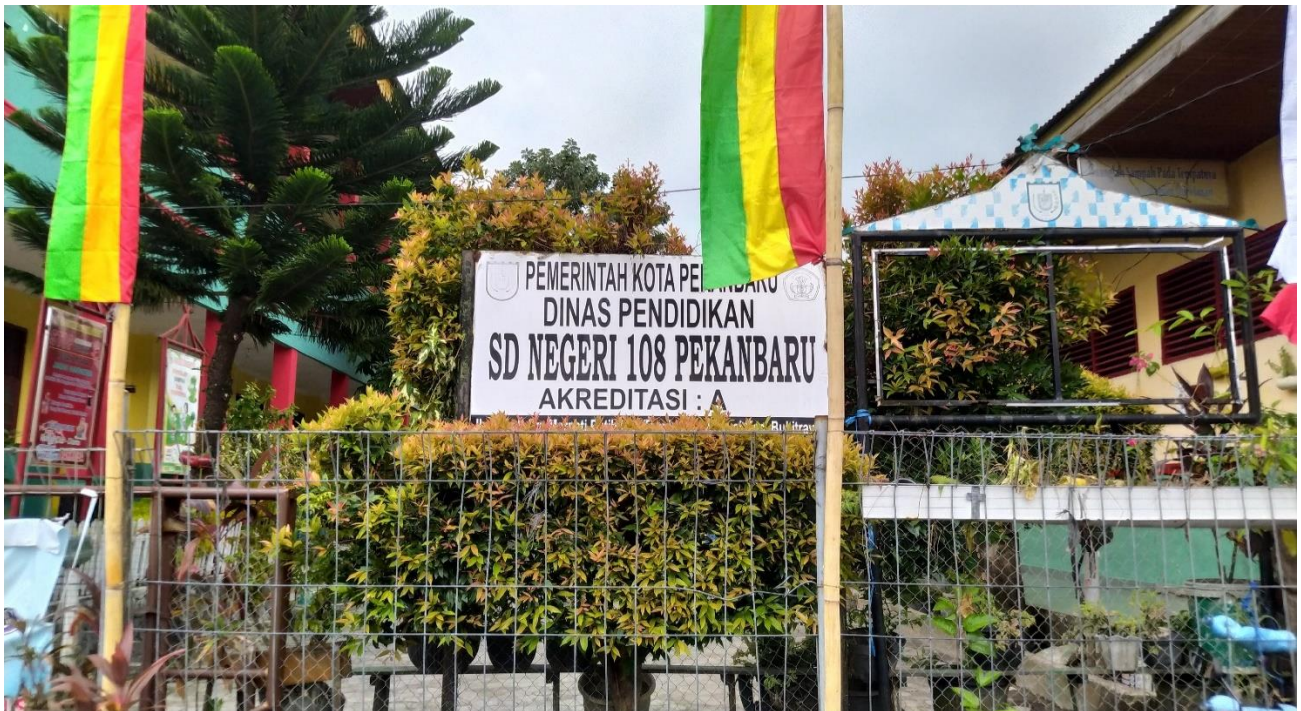
Keterangan : Lokasi/Tempat Penelitian di SD NEGERI 108 PEKANBARU (Tampak Depan)