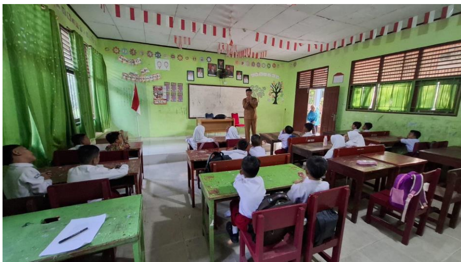
Suasana Kegiatan Pembelajaran Di Dalam Kelas