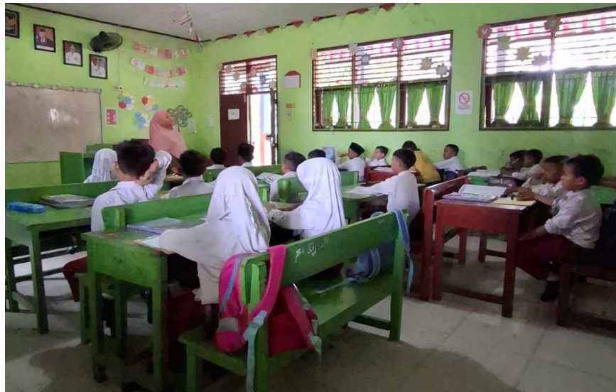
Suasana Kegiatan Pembelajaran Di Dalam Kelas