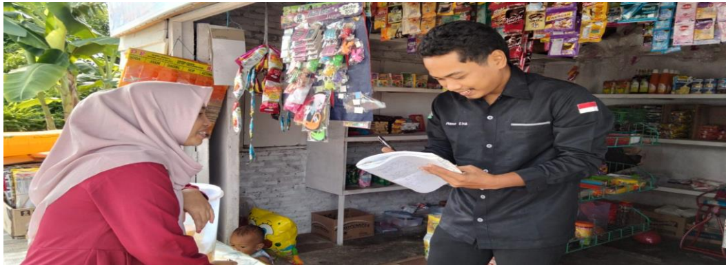
Wawancara Terhadap Konsumen Arsy Risoles