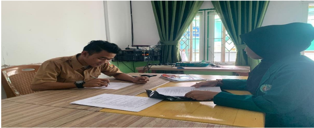
Gambar V.5 : Wawancara ustadz guru wali kelas V