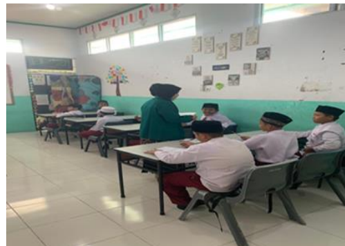
Gambar 4 : Proses pembagian dan pengisian angket