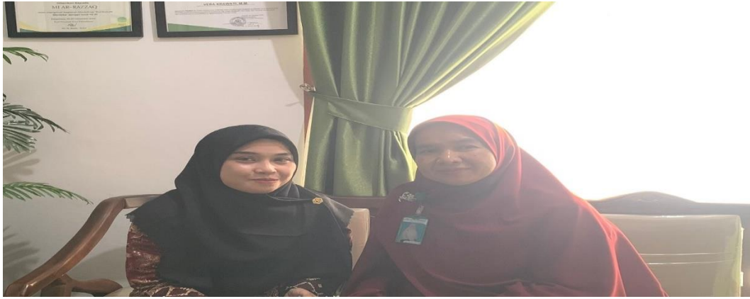
Gambar 1 : Pengantaran surat izin meneliti sekaligus wawancara ibu kepek