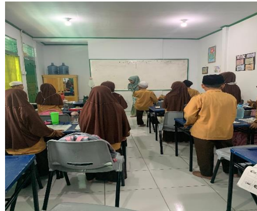
Gambar 2 : Proses Pembelajaran