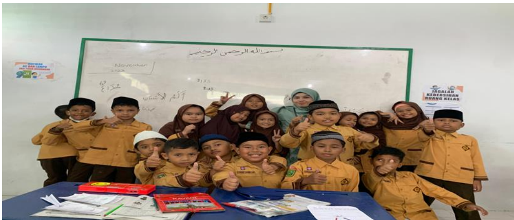
Gambar 6 : Poto bersama anak-anak MI Ar-Razzaq