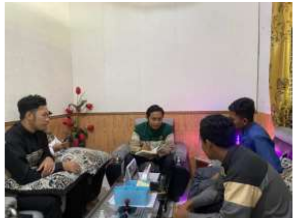
Wawancara dengan Ketua dan staf Bagian Administrasi Pondok Modern Darussalam Gontor Kampus 12