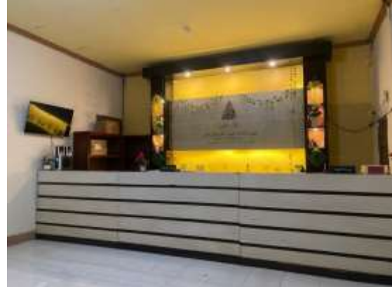
Kantor Bagian Administrasi Pondok Modern Darussalam Gontor Kampus 12 Siak