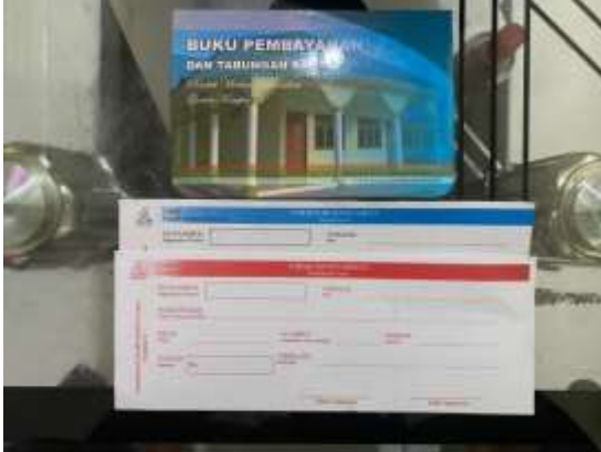
Buku tabungan siswa, slip penarikan dan slip pengambilan