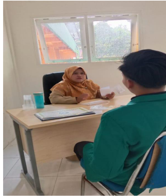
WAWANCARA DENGAN GURU PENDIDIKAN AGAMA ISLAM SD NEGERI 152 PEKANBARU