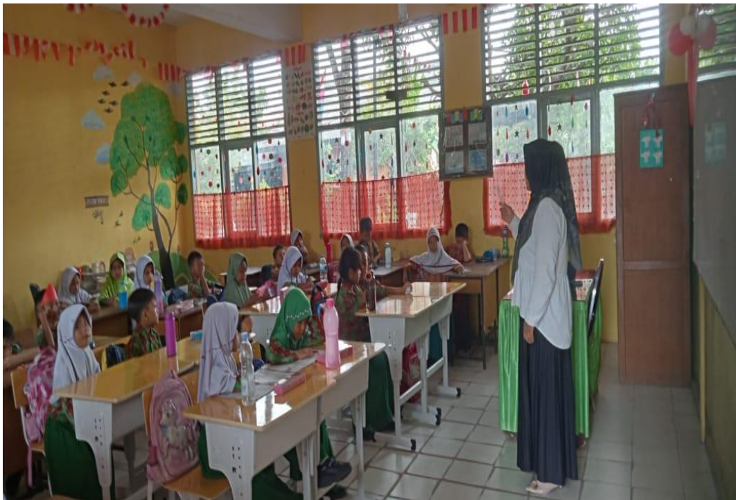
GURU PENDIDIKAN AGAMA ISLAM SEDANG PROSES BELAJAR MENGAJAR