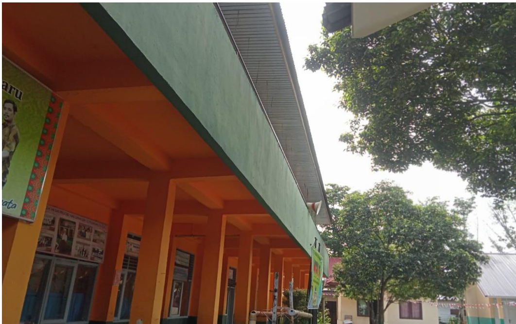
GEDUNG SEKOLAH SD NEGERI 152 PEKANBARU