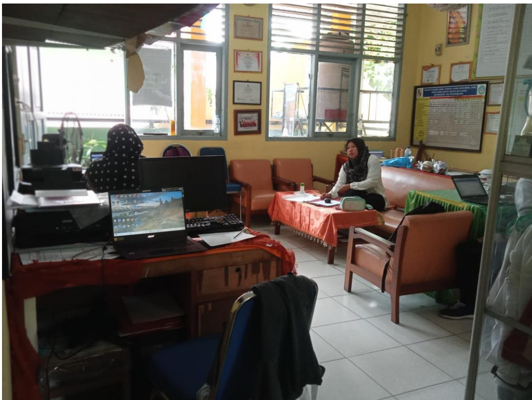
RUANG MAJELIS GURU SD NEGERI 152 PEKANBARU