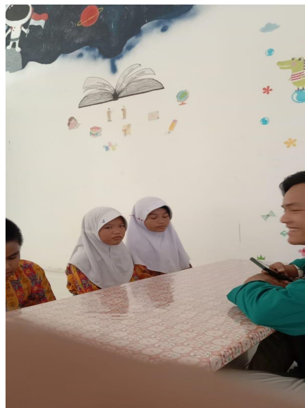
WAWANCARA DENGAN SISWA-SISWI SD NEGERI 152 PEKANBARU