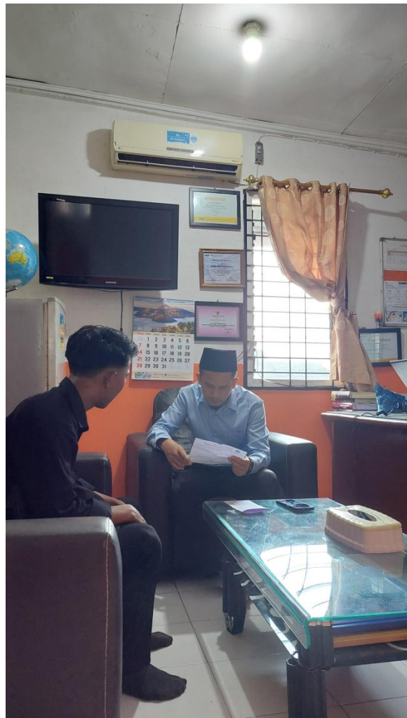
WAWANCARA DENGAN KEPALA SEKOLAH SD JUARA PEKANBARU