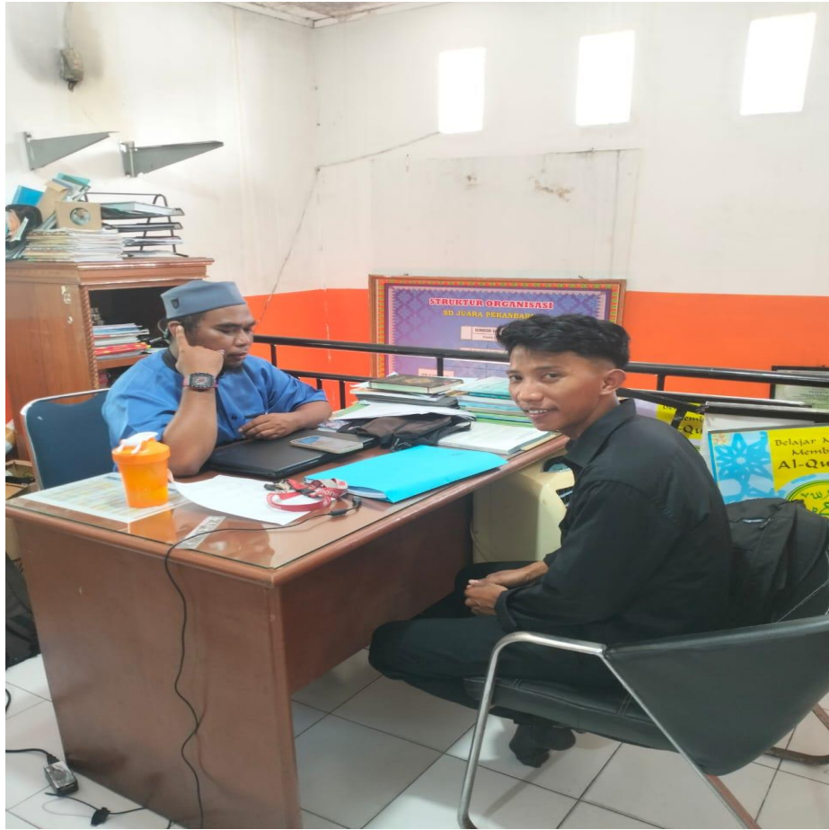
WAWANCARA DENGAN GURU PENDIDIKAN AGAMA ISLAM SD JUARA PEKANABARU