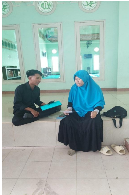
WAWANCARA DENGAN WAKA KURIKULUM SD JUARA PEKANBARU