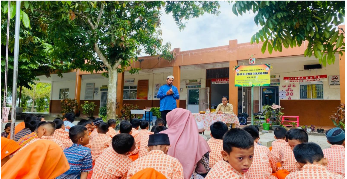
Gambar 7: Foto murid SD IT Al Fath mendengarkan ceramah ustadz dalam rangka Maulid Nabi Muhammad SAW