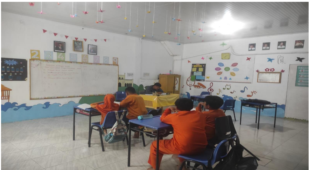
Gambar 6: Foto suasana belajar di dalam kelas