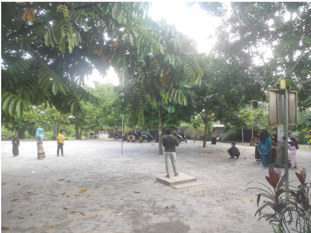
Gambar 8: Foto Murid SD IT Al Fath sedang melakukan ekstrakurikuler