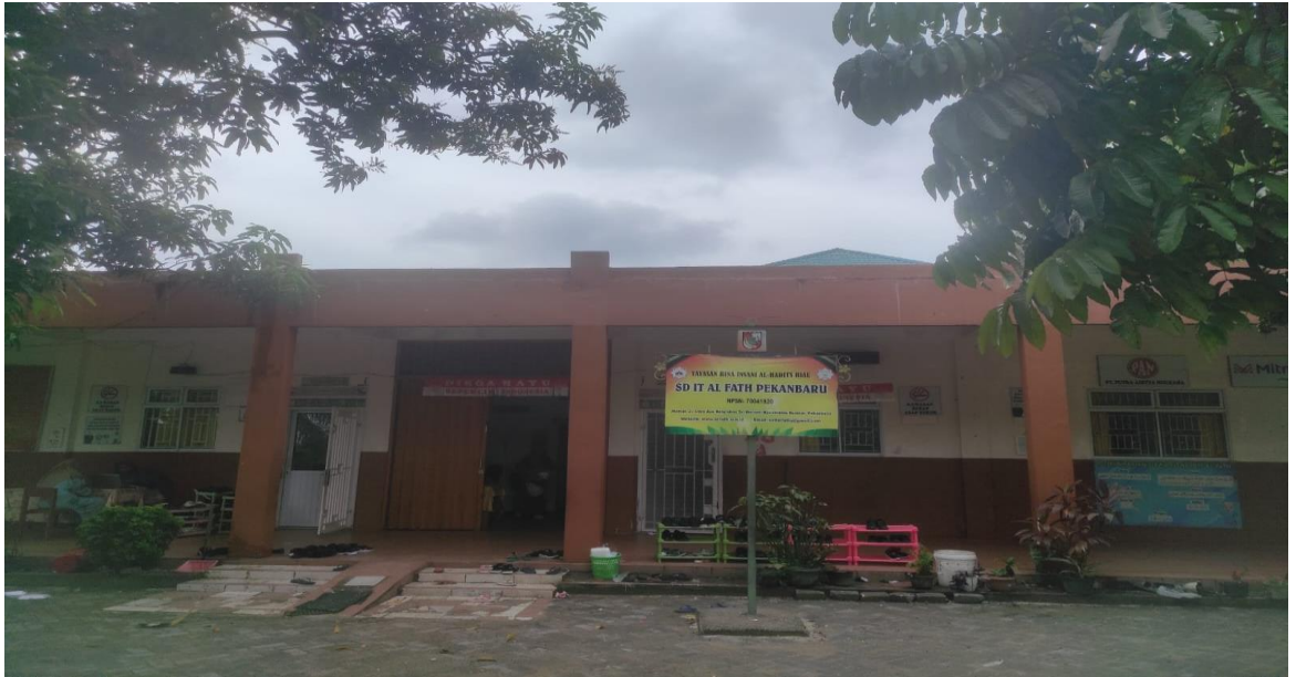
Gambar2: Foto SD IT Al Fath Pekanbaru