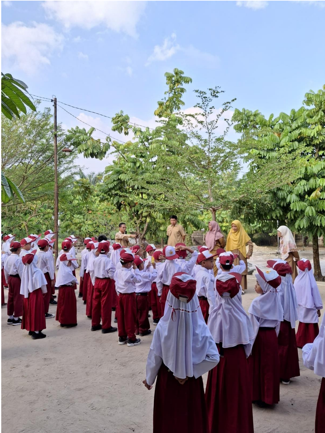
Gambar 4: Foto literasi oleh Kepala sekolah di pagi hari sebelum masuk kelas