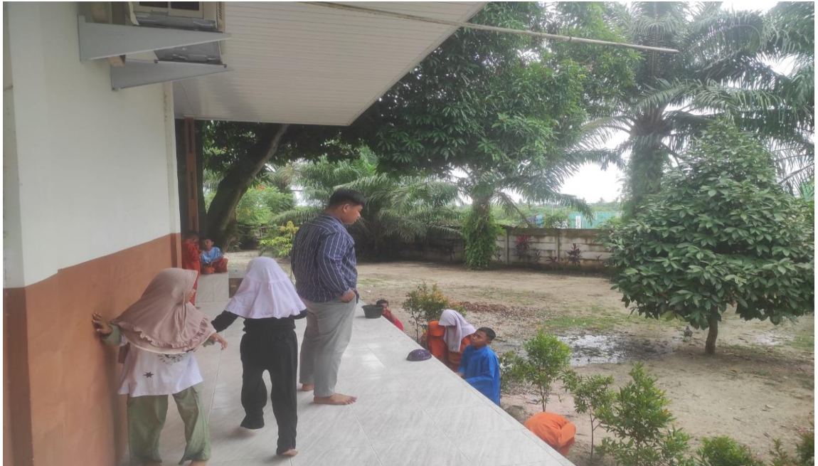
Gambar 5: Foto guru PAI membimbing anak berwudhu untuk melaksanakan shalat ashar