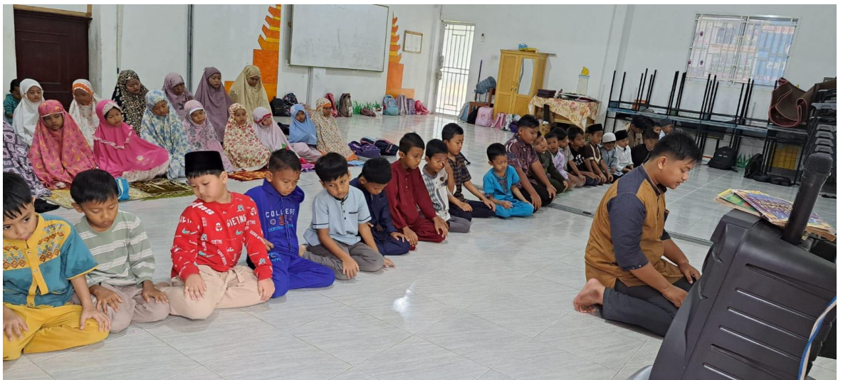
Gambar3: Foto guru PAI membimbing dan menjadi imam sholat dzuhur