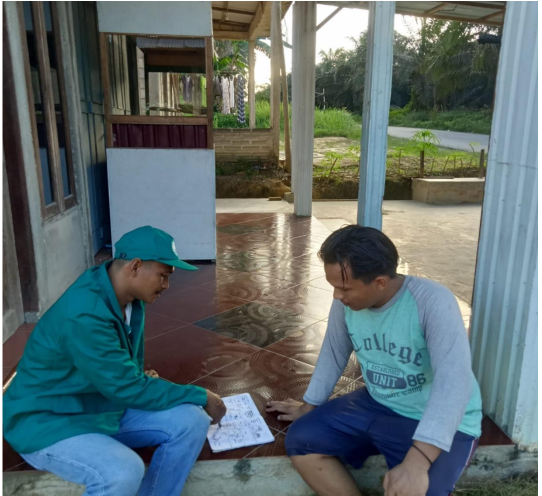
Wawancara dengan narasumber masyarakat Kampung Lubuk Dalam