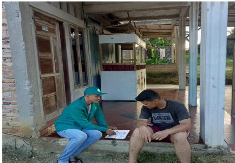
Wawancara dengan narasumber Bapak Golkar selaku kepala desa Lubuk Dalam