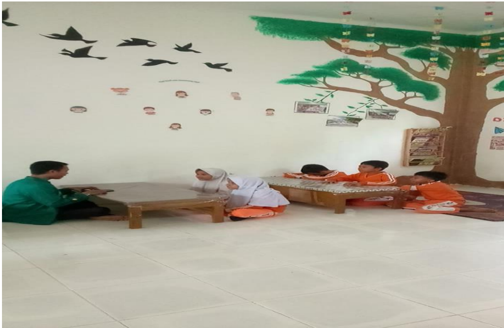
Dokumentasi Ketika Wawancara Dengan Siswa Kelas V