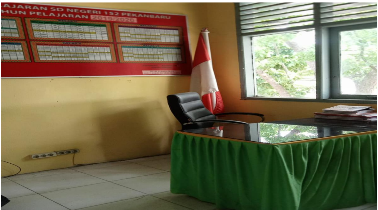
Ruang Kepala Sekolah SD Negeri 152 Pekanbaru