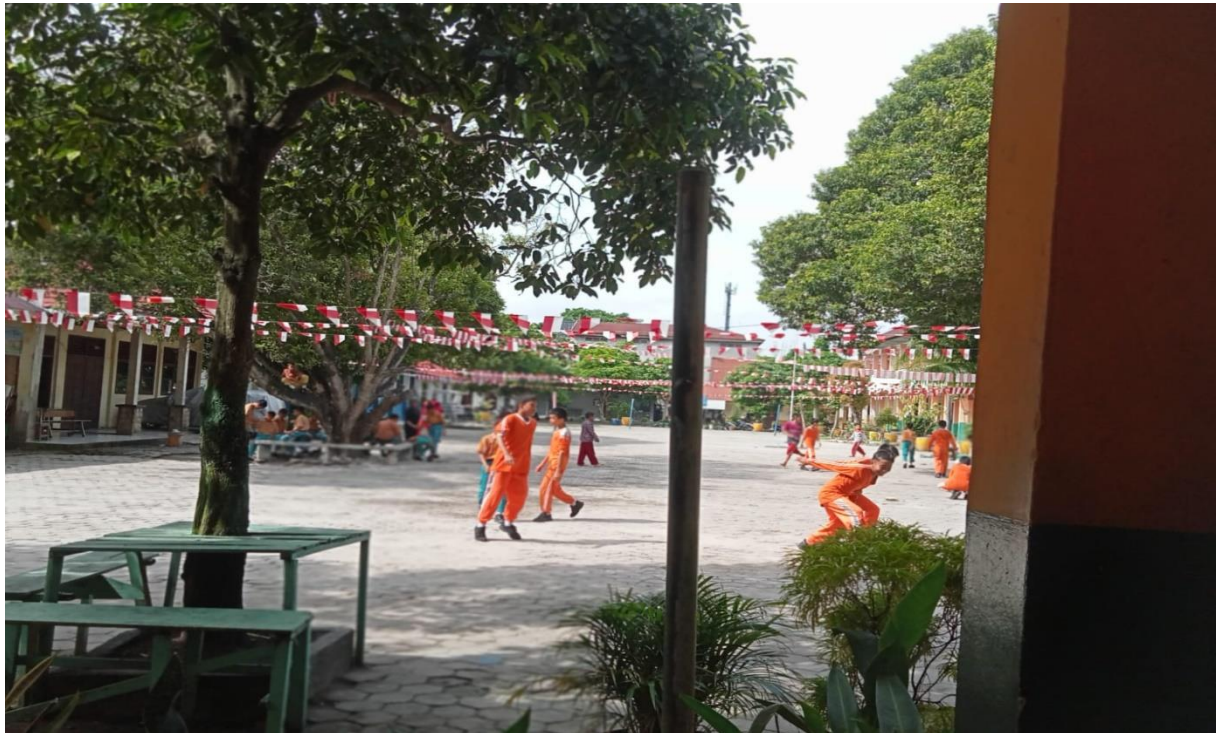
Gedung Sekolah Dasar Negeri 152 Pekanbaru