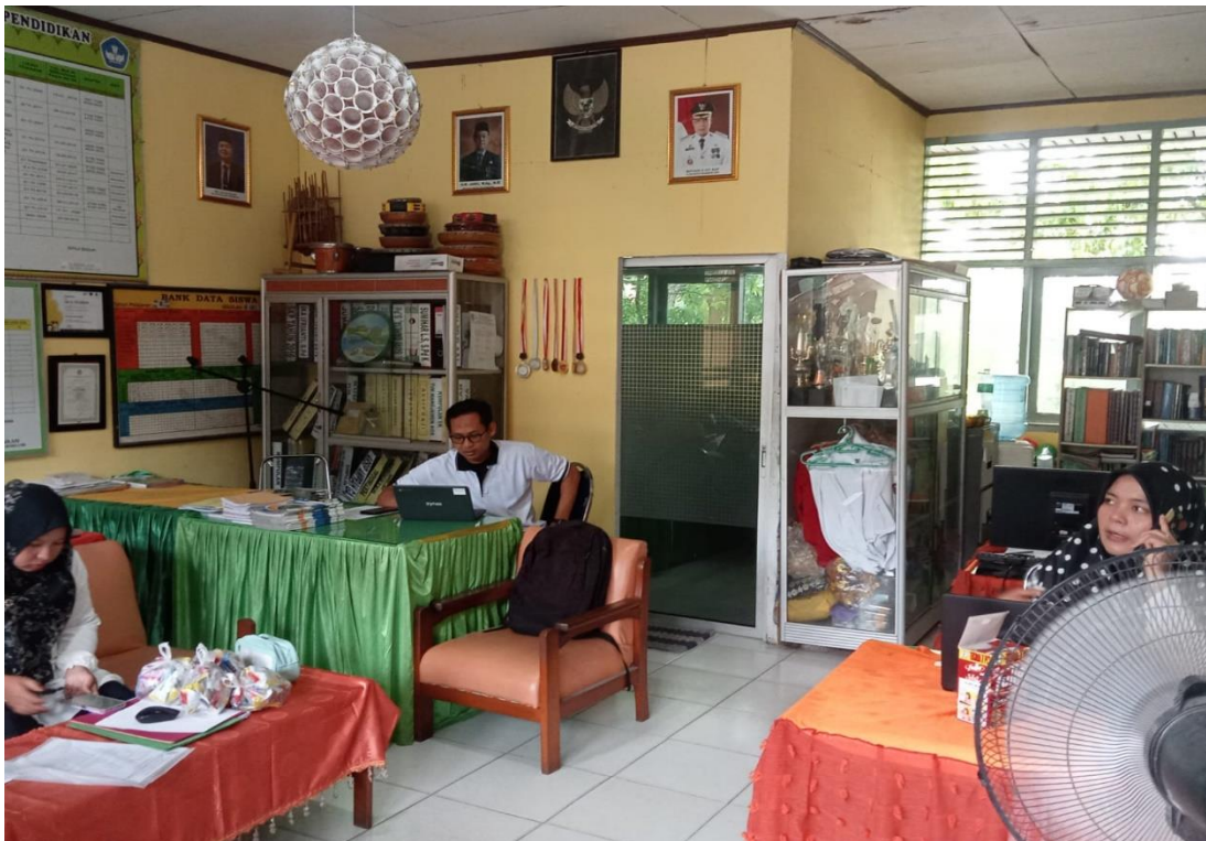
Ruang Majelis Guru SD Negeri 152 Pekanbaru