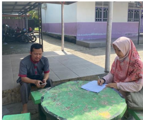
Gambar 3 (Wawancara dengan Kepala Sekolah)