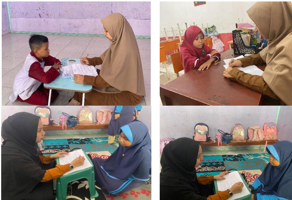
Gambar 4 (Wawancara dengan Siswa)