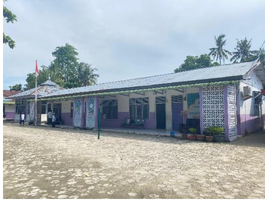
Gambar 1 (Foto Depan Sekolah)