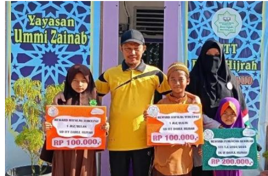
Gambar 8 (Sekolah memberikan reward bagi siswa yang cepat menghafal)