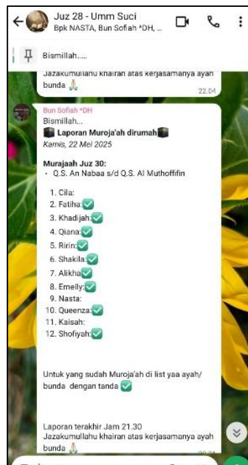
Gambar 9 (Grup WA guru tahfidz dan Orang tua)