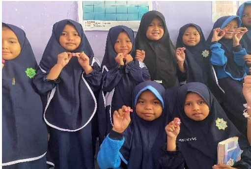
Gambar 7 (Guru memberikan reward berupa bros jilbab kepada siswa)