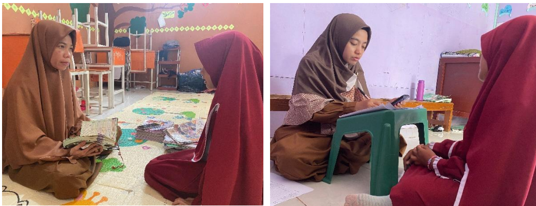
Gambar 5 (Guru sedang menyimak setoran hafalan siswa)