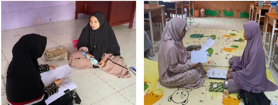
Gambar 2 (Wawancara dengan Guru Tahfidz)