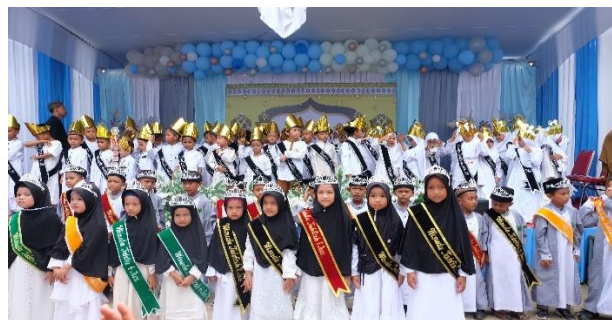
Gambar 10 (Wisuda Tahfidz SDIT Darul Hijrah)