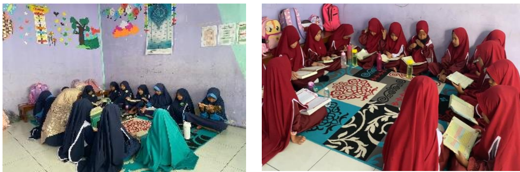
Gambar 6 (Guru sedang mentalaqqi siswa dengan posisi membentuk halaqoh)