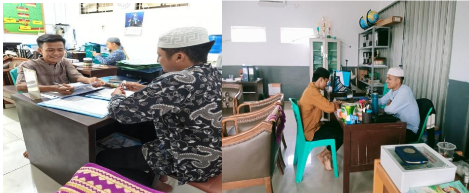
Gambar 4. 2 Suasana Wawancara bersama Guru Qur'an SD IT Al-Qudwah