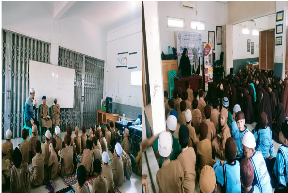
(Kegiatan Tasmi' umum ikhwan sebelum sholat zuhur)