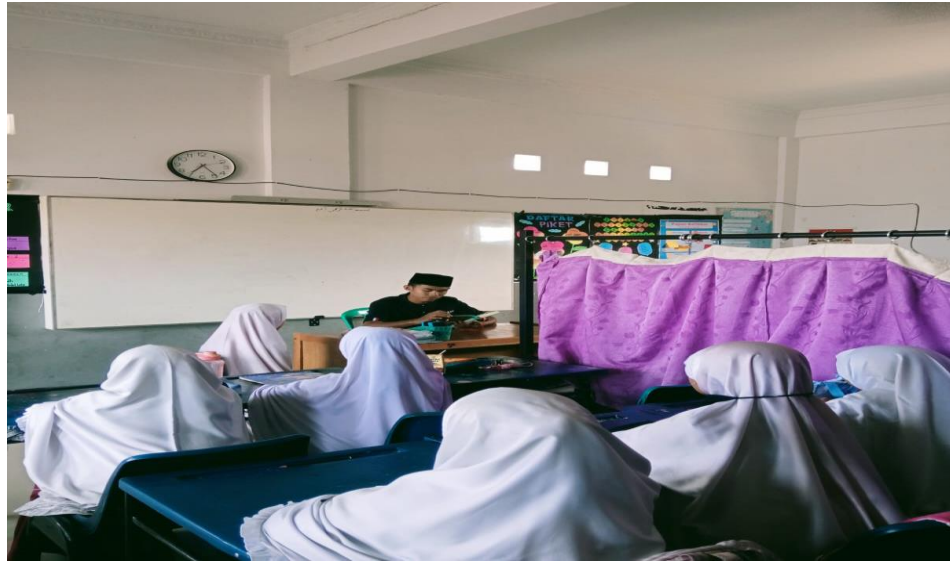
(Kegiatan Belajar Mengajar Al-Qur'an)