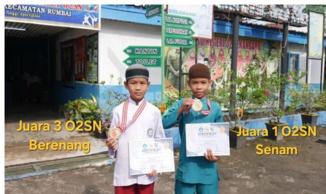
( Siswa SDIT AL QUDWAH mendapatkan juara 3 O2SN lomba renang Dan Juara 1 O2SN lomba Senam artistic kategori anak-anak )