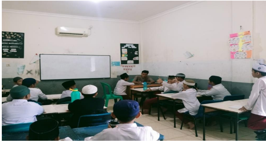
Gambar 4. 4 Suasana Wawancara bersama Siswa Kelas VA