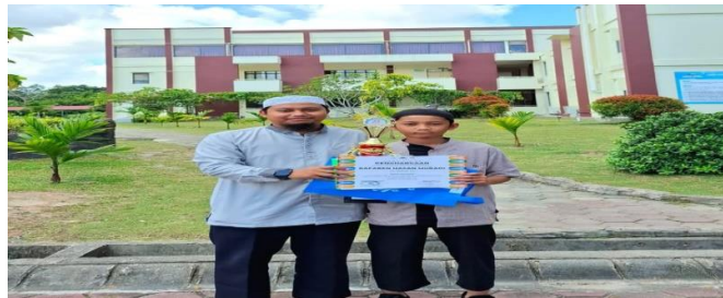
( Siswa kelas 6 mendapatkan juara tiga lomba MHQ yang di selenggarakan pihak SDIT AL-ITTIHAD )