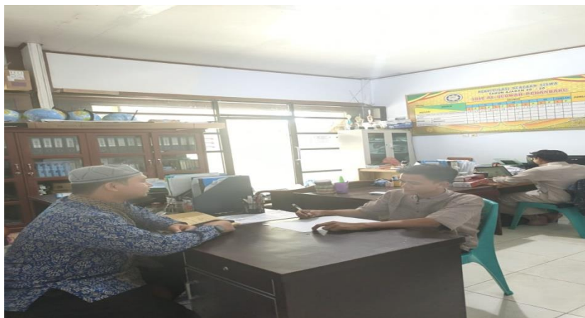
Gambar 4. 1 Suasana Wawancara bersama Kepala Sekolah SD IT Al-Qudwah

Jawaban : Toyyib kita di sekolah sudah menghimbau agar seluruh Guru Qur'an SD IT Al-Qudwah agar dapat memberikan nasehat atau motivasi tentang qur'an dan keutamaan bagi penghafalnya kepada siswa supaya mereka tau bahwasanya menghafal Al-Qur'an itu pahala dan keutamaannya sangat luar biasa. 44