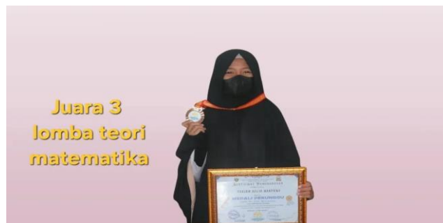
( Siswa SDIT AL-QUDWAH Mendapatkan juara 3 lomba teori matematika, Yang di selenggarakan event cendana di SMP cendana,rumbai )