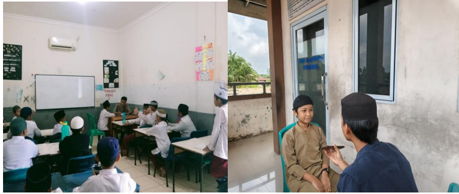
( Wawancara Bersama Siswa Kelas VA dan kelas VI A)