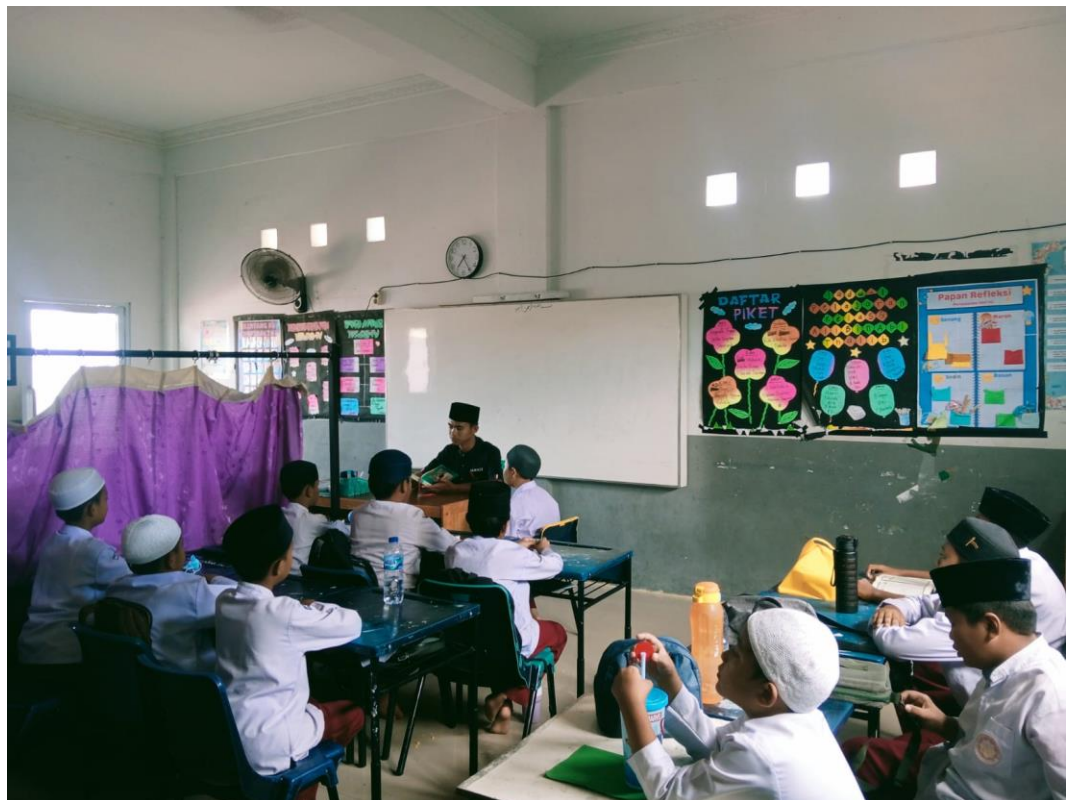
(Kegiatan Belajar Mengajar Al-Qur'an)