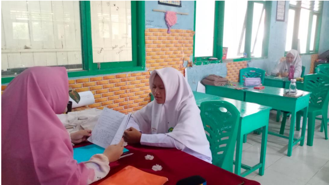
Gambar 3. Proses Pembelajaran Talim Muta'alim Kelas IX