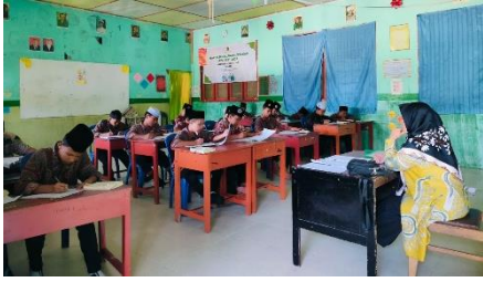
Kegiatan belajar mengajar