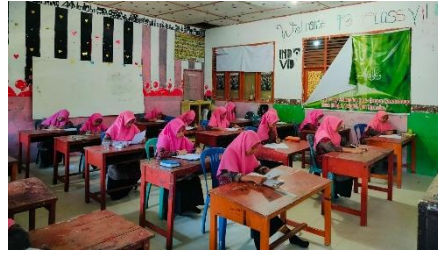
Kegiatan belajar mengajar