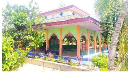
Mesjid MTs Fataha Siak