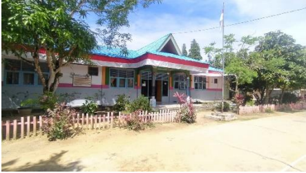
Halaman kantor MTs Fataha Siak