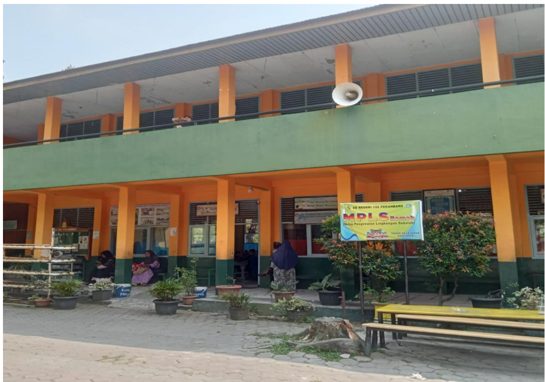
GEDUNG SEKOLAH SD NEGERI 152 PEKANBARU