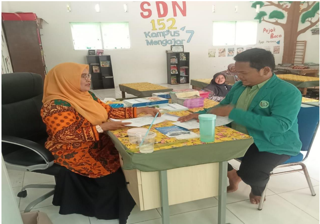
WAWANCARA DENGAN KEPSEK SD NEGERI 152 PEKANBARU