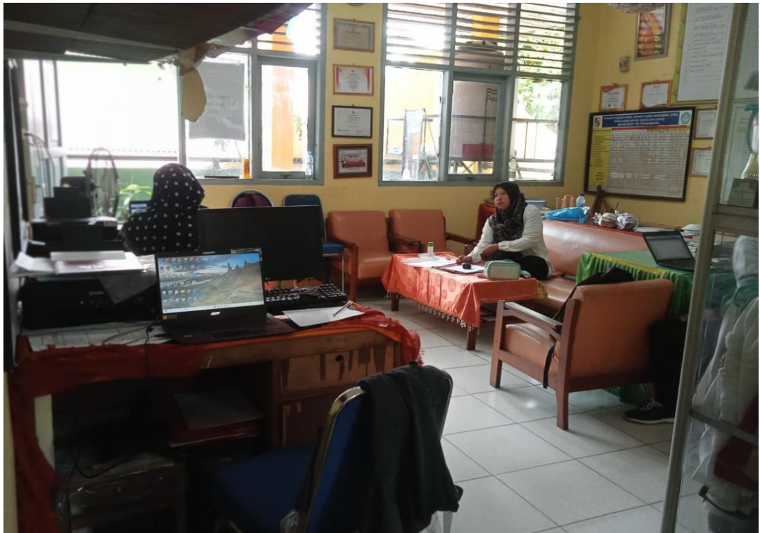
RUANG MAJELIS GURU SD NEGERI 152 PEKANBARU