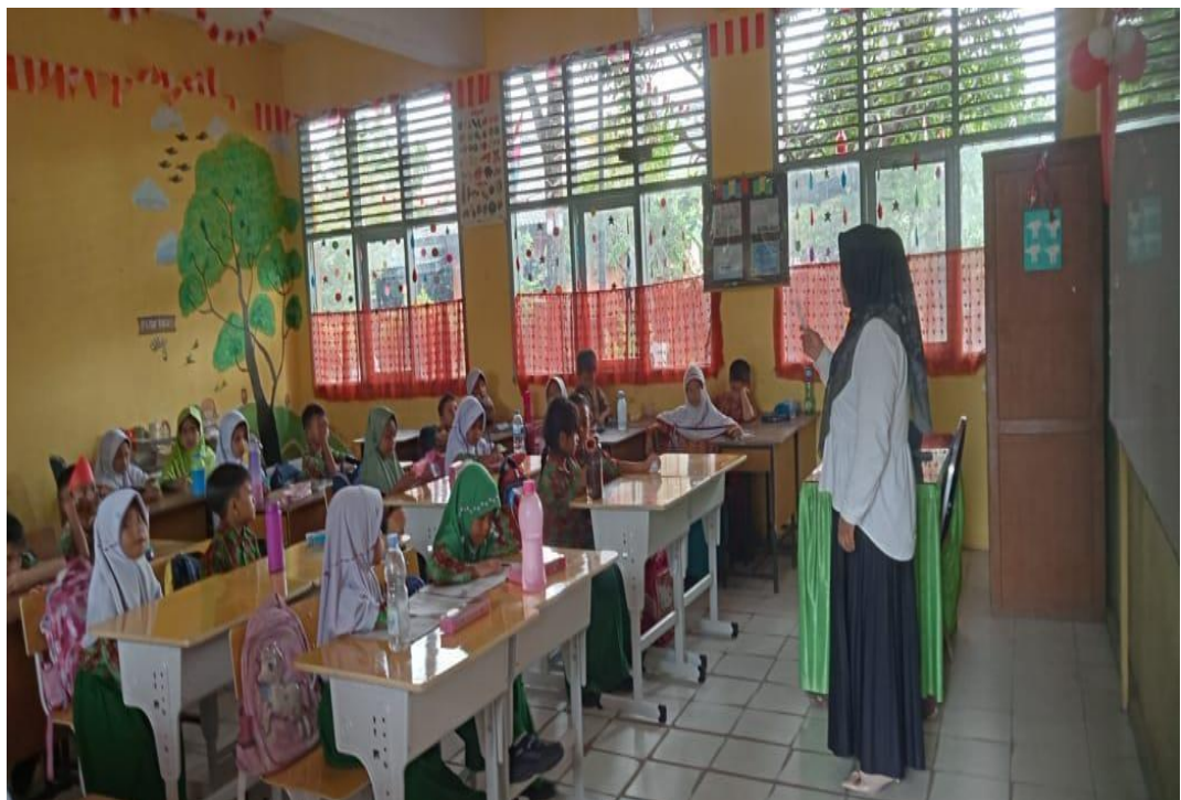
GURU PAI SEDANG PROSES BELAJAR MENGAJAR DI DALAM KELAS