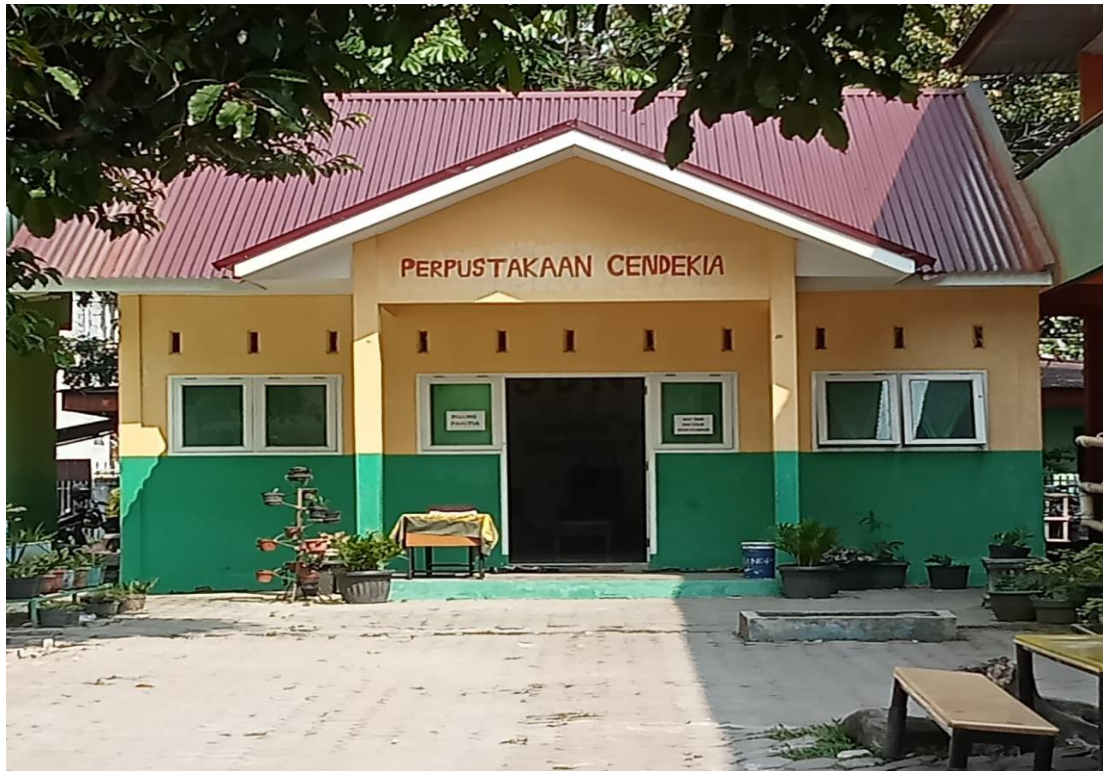
PERPUSTAKAAN SD NEGERI 152 PEKANBARU