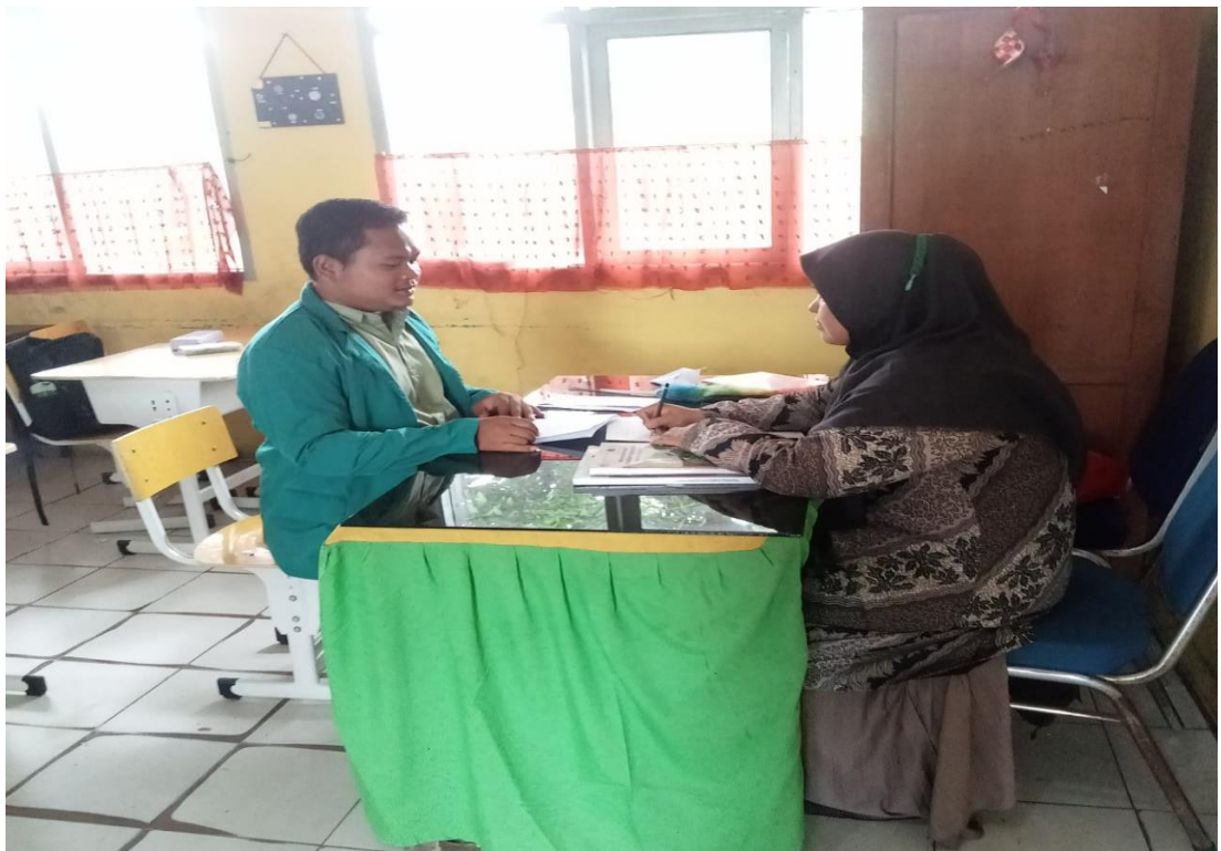
WAWANCARA DENGAN GURU PAI SD NEGERI 152 PEKANBARU