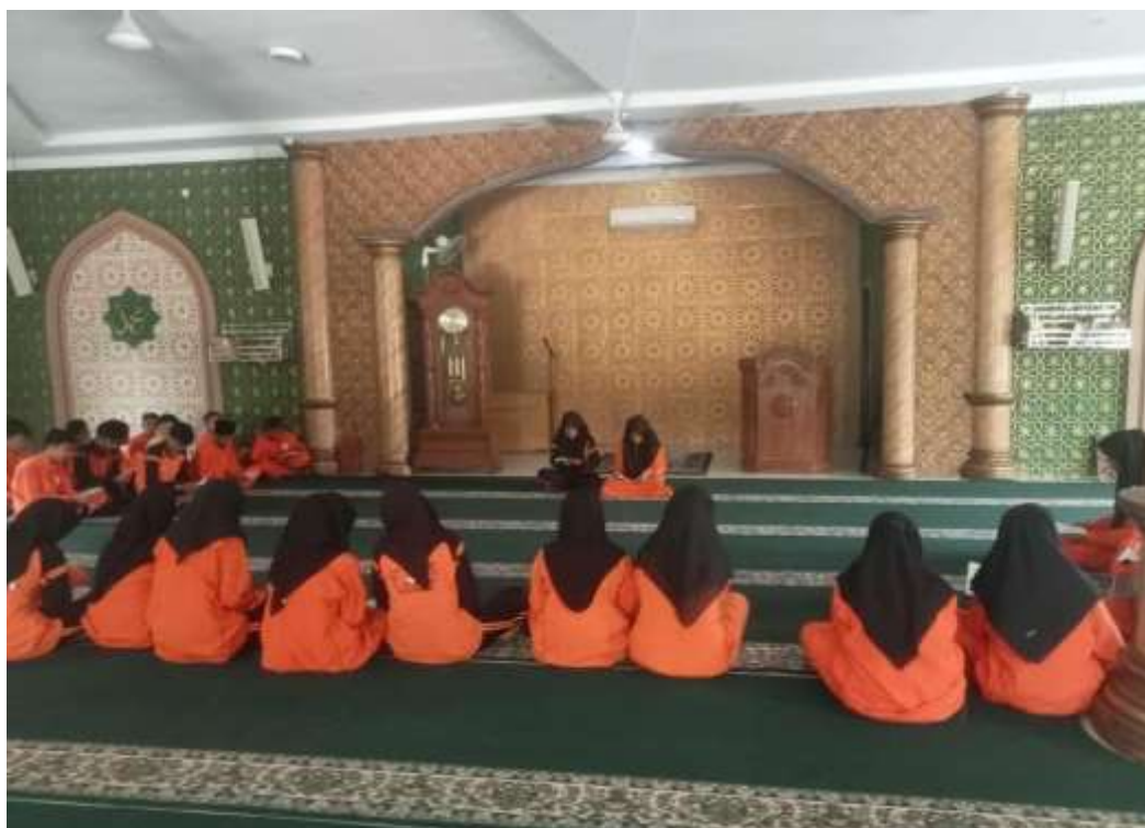
Gambar 1.2 siswa siswi sedang melakukan bacaan yasinan dalam kegiatan dihari jumat.

Salah satu guru pembinaan keagamaan yaitu bapak Zulfikar, SPd. 58 bahwa beliau mengatakan :