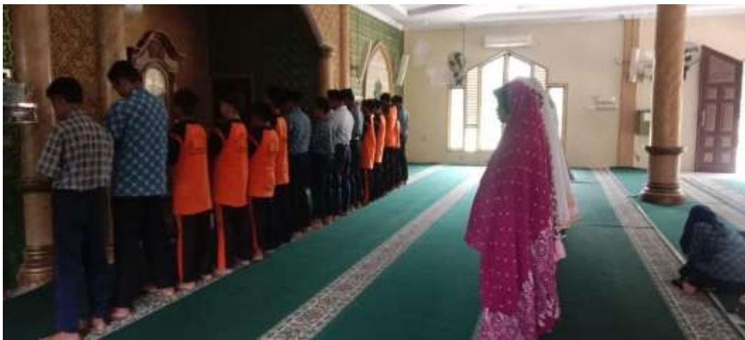
Gambar 1.1 Siswa siswi sedang melaksanakan sholat dhuha berjama'ah.

Berdasarkan hasil observasi penulis, persiapan pelaksanaan kedisiplinan dalam pelaksanaan sholat dhuha MTs Baitul Amal, ada beberapa persiapan diantaranya ada sebagian siswa membersihkan masjid dengan koordinasi oleh Pembina