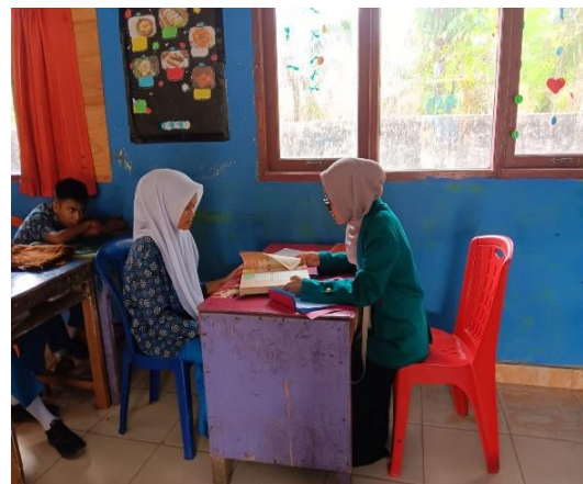
Observasi dan Wawancara, sekaligus menyimak langsung Bacaan Al-Qur'an Siswa-Siswi Kelas IX