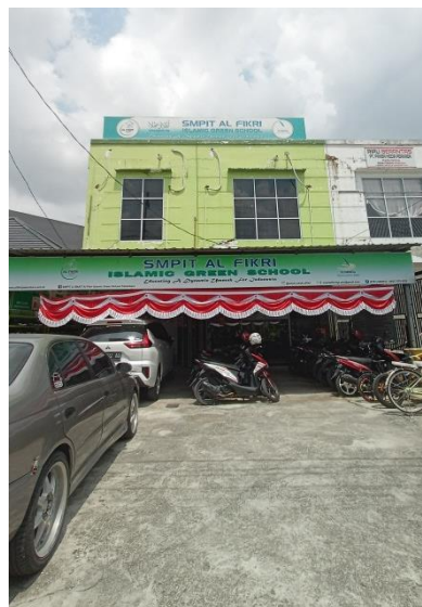
Foto Sekolah SMPIT Al-Fikri Islamic Green School Pekanbaru