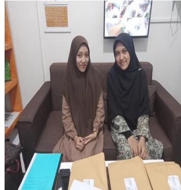
Foto Proses Pembelajaran Al-Qur'an Siswa SMPIT Al-Fikri