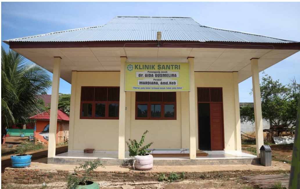
Foto klinik santri