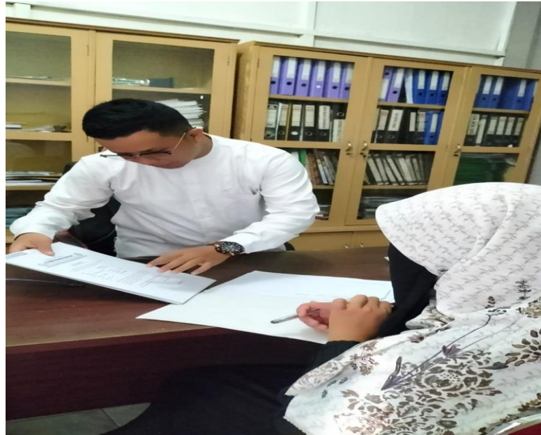
Pengumpulan Data dengan TU Pon-Tren Ni'matullah