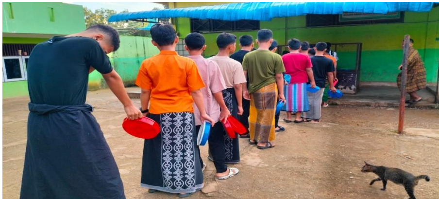
Dokumentasi santri mengantri makan