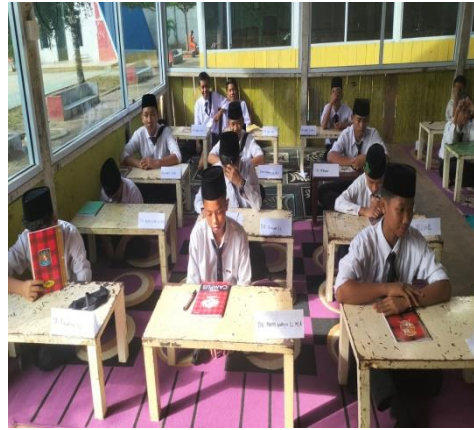
Foto pembelajaran di kelas