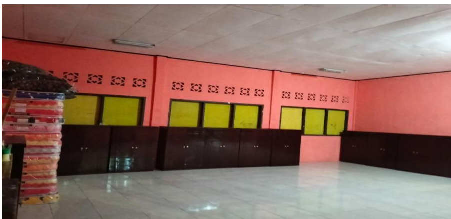
foto kamar santri