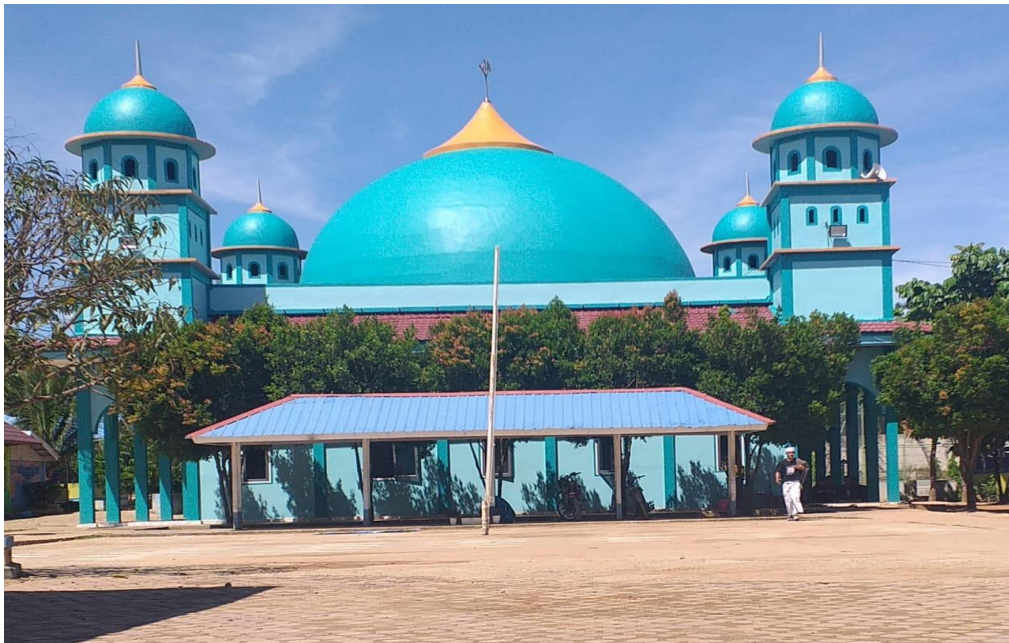
Masjid Pon-Tren Ni'matullah