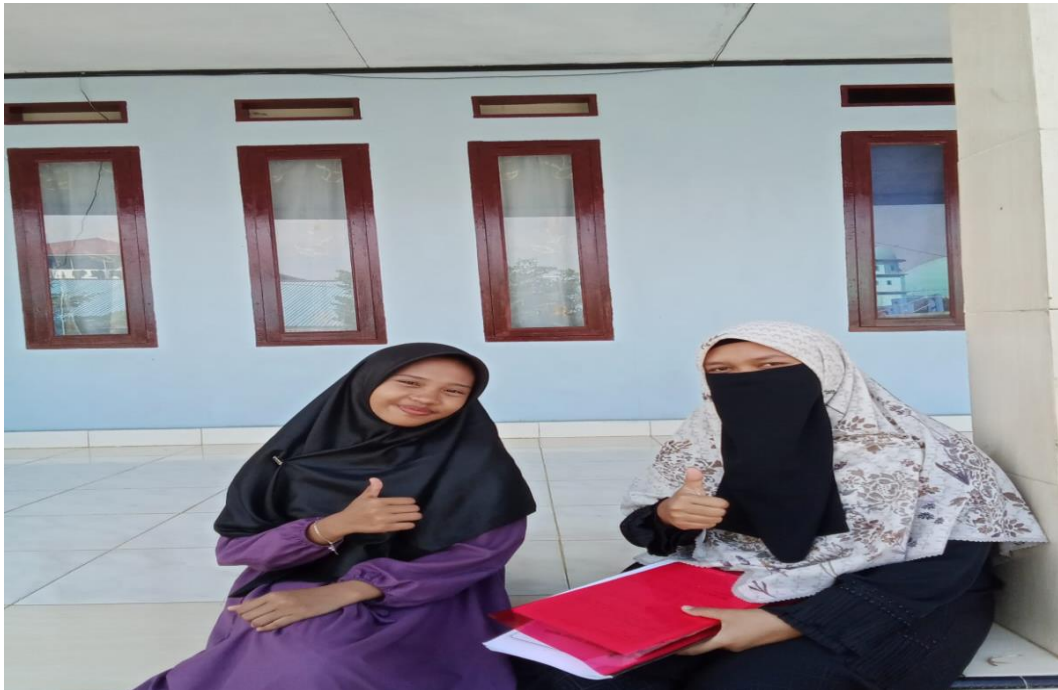
Wawancara dengan santri