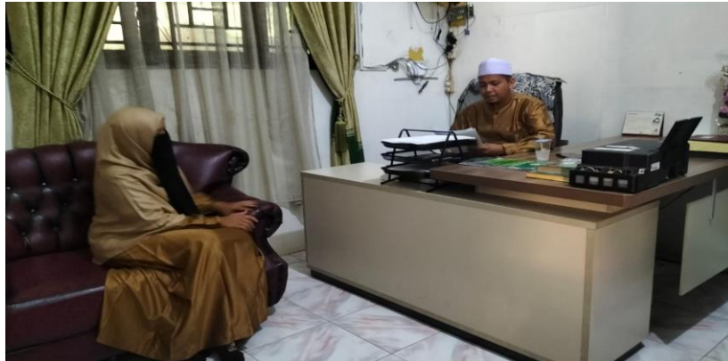
Wawancara dengan Kepsek MTs