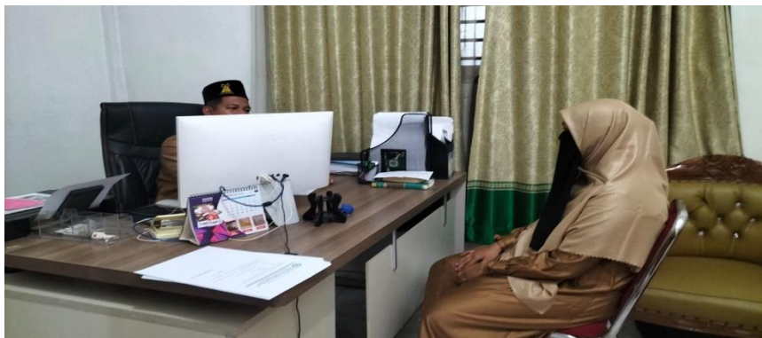
Wawancara dengan kepek MA