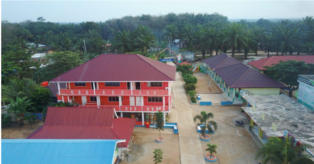
Halaman Depan Pon -Tren Ni'matullah