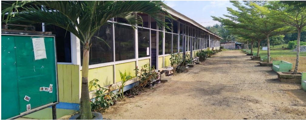
Foto kelas Panggung